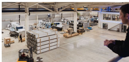
„Ein Mitarbeiter in der TruLaser Tube 7000-Fabrik.“