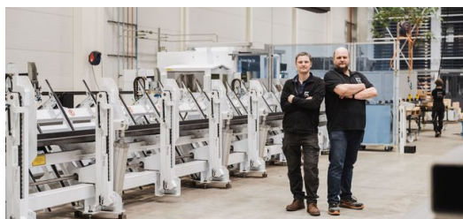
„Zwei Mitarbeiter in der Produktion.“