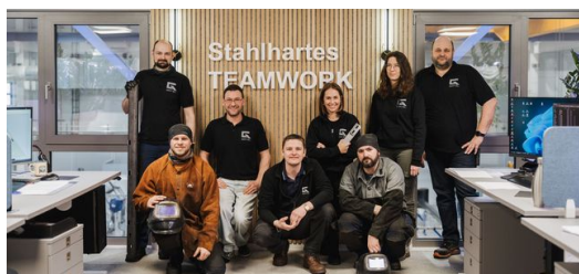
„Stahlhartes TEAMWORK“: Ein Team von Mitarbeitern in der Produktion.

„Götzl ist ein wichtiger Bestandteil unserer TruLaser Tube 7000, die im Jahr 2017 entwickelt wurde.“