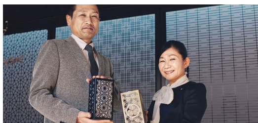
Bestseller: Stínítka svítek s komplexními geometrickými vzory – každé z nich je unikát.