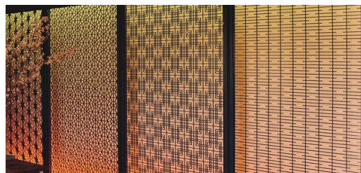
<p>Vysoká přesnost: Stará forma umění Kumiko tvoří pevnou součást v japonské architektuře. Typická použití jsou například dřevěné stěny.</p>