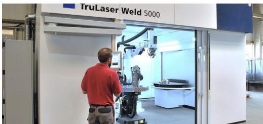
Geld gespart: Bei dem Blechbearbeiter Schink arbeiten die Laserschweißzelle TruLaser Weld 5000 und die Laserschneidanlage TruLaser 3040 im sogenannten LaserNetwork. Sie nutzen also gemeinsam die vier Kilowatt starke Festkörperlaserquelle TruDisk 4001.

Am Beispiel des bereits erwähnten Mehlstreuers machen die oberfränkischen Blechexperten deutlich, in welcher Kategorie die Produktivitätssteigerungen liegen. Ein Handschweißprozess benötigt inklusive aufwendiger Vorbereitung und diverser Nachbearbeitungen etwa 110 Minuten. Mit der TruLaser Weld 5000 erledigt Schink das prozesssicher in gut 10 Minuten – Vorbereitung inbegriffen. Nacharbeit ist nicht notwendig!