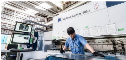
<p>Ein Mitarbeiter arbeitet an der <a href="https://www.trumpf.com/de_DE/produkte/maschinen-systeme/biege-maschinen/trubend-center-serie-5000/">TruBend Center 5030</a>: So wird der Stuhl „Orisu“ hergestellt.</p>