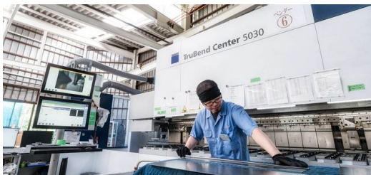
<p>Ein Mitarbeiter arbeitet an der <a href="https://www.trumpf.com/de_DE/produkte/maschinen-systeme/biege-maschinen/trubend-center-serie-5000/">TruBend Center 5030</a>: So wird der Stuhl „Orisu“ hergestellt.</p>