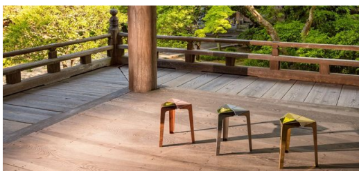
Der Stuhl „Orisu“ ist etwas Besonderes: Er macht abstrakte Technologien für den Betrachter sichtbar.