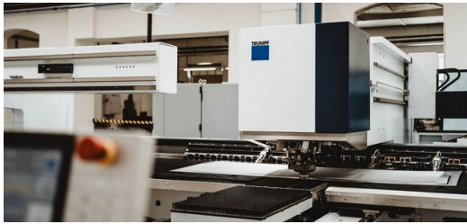
Eine für alles: Die TruPunch 5000 ersetzt nicht nur die historische Maschine, sondern übernimmt Aufgaben, die früher sieben Maschinen erledigten.