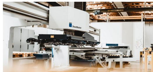
Automatisierung: Der SheetMaster versorgt die TruPunch 5000 mit dem benötigten Material. Das steigert die Effizienz und entlastet Mitarbeiter.