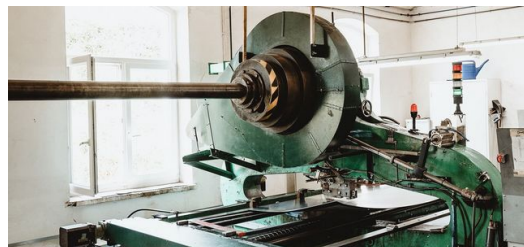
Verdienter Ruhestand: Nach 130 Jahren geht die alte Stanzmaschine Ende des Jahres in den Ruhestand. Die TruPunch 5000 übernimmt.