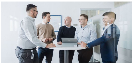
Teamarbeit: Technischer Kundendienst und Qualitätsverantwortliche im direkten Dialog. Rückmeldungen aus dem Feld fließen strukturiert zurück in Entwicklung und Planung.