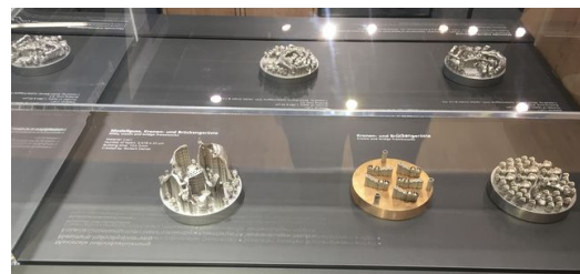
Substratplatten mit 3D-gedrucktem Zahnersatz.