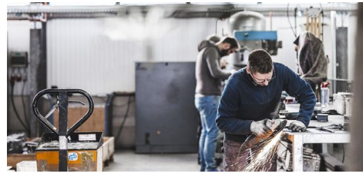
2015 zog IBEX in eine 2.300 Quadratmeter große Produktionshalle mit angeschlossenem Büro in Dresden.