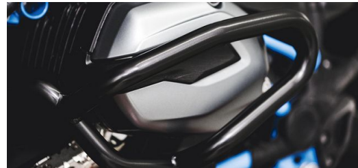
IBEX hat sich das Ziel gesetzt, alles rund ums Motorrad aus Blech zu fertigen. Zum Produktportfolio gehört zum Beispiel dieser Sturzbügel.