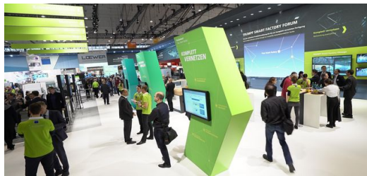
Dank der grünen T-Shirts der TruConnect Berater wurden Besucher, die Fragen zu den TRUMPF Lösungen für die Smart Factory hatten, schnell fündig.