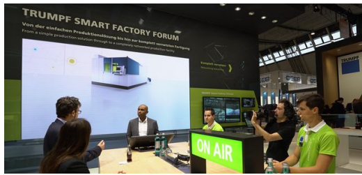
Von Beratungsdienstleistungen über Automatisierung bis hin zur komplett digital vernetzten Fertigung – vier TRUMPF Experten stehen dem Moderator Chris Brow zu diesen Themen Rede und Antwort.