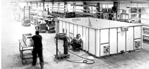
In einem Stück: Pools mit Standardmaßen werden bei Gassner komplett zusammengebaut und per Tieflader an den Zielort transportiert.