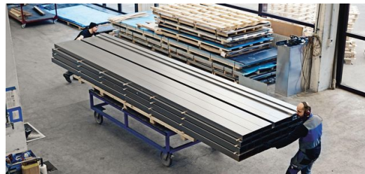
Spezialisiert: Neben kleinen Blechen und Einzelanfertigungen bearbeitet BIGSTEEL AG auch großformatige Blechteile.