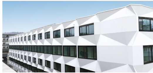
Wie gemalt: Die Fassade der Universität Luzern stammt von BIGSTEEL.