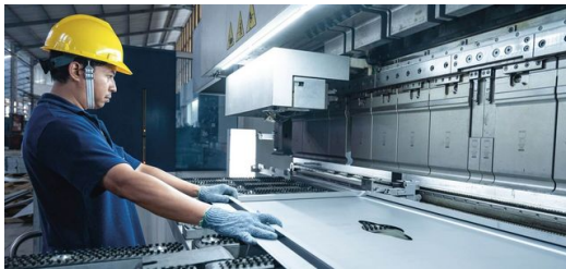
<p>Mit moderner Technologie von TRUMPF kann das Unternehmen hohe Stückzahlen in gleichbleibender Qualität herstellen.</p>