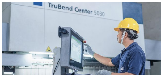
<p>Neue Möglichkeiten: Früher haben Mitarbeiter fünf bis sechs Teile geschweißt und gebogen, um die Tür für das Gepäckfach herzustellen. Dank TruLaser 5030 und TruBend Center 5030 benötigt Tentrem dafür heute nur noch ein Blech.</p>

Im kommenden Jahr plant er in die TRUMPF Software Oseon zu investieren. „Ein Bus besteht aus vielen tausend Einzelteilen. Wenn es uns gelingt, die Produktion effizient zu organisieren, sparen wir Zeit und Geld. Oseon kann uns dabei helfen.“ Es sei wieder wie 2015, vor dem Kauf der ersten TRUMPF Maschine. „Wir wissen, was die Technik kann. Jetzt müssen wir nur noch lernen, damit umzugehen“, sagt er. Die Maschinen produzieren stets in gleichbleibend hoher Qualität. Das bietet in vielen Bereichen Vorteile.