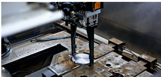
Jeder Rohling ist seit 2015 mit einem sogenannten Data-Matrix-Code versehen.