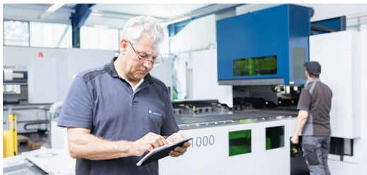
Bestellung: Das Online-Ordern ist zum Standard geworden.

Die Beschriftung hilft beim Kommissionieren und Versenden, dem letzten Schritt. Und auch der funktioniert weitgehend von alleine. Die zuständigen Mitarbeiter werden benachrichtigt, sobald ein Auftrag vollständig ist, also alle bestellten Artikel bereitstehen. Durch die intelligente Vernetzung können bis 14 Uhr bestellte Standardwerkzeuge noch am selben Tag verschickt werden. Der Prozess ist mit einer Liefertreue von 98 Prozent äußerst zuverlässig. Nachdem der Speditionsleister das Stanzwerkzeug abgeholt hat, geht es auf direktem Weg zum Kunden.