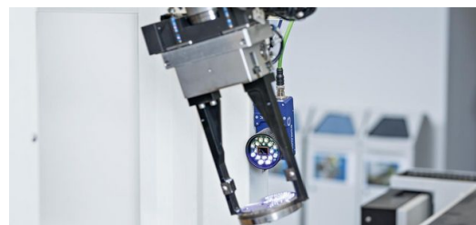
Laserbeschriften: Die Beschriftung hilft beim Kommissionieren und Versenden.