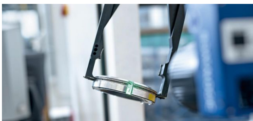
Der Data-Matrix-Code hilft dabei Prozesse zu standardisieren.