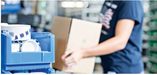
Verpacken: Die zuständigen Mitarbeiter werden benachrichtigt, sobald ein Auftrag vollständig ist.