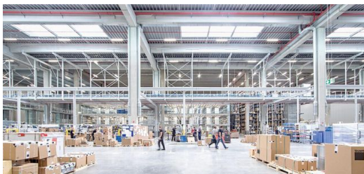
Das neue TRUMPF Logistikzentrum hat eine Grundfläche von 13.000 Quadratmetern, 18 Meter hohe Decken – und liefert jeden Monat mehr als 60.000 Artikel aus.

Nach einer Förderband-Reise quer durch die Halle kommt die blaue Kiste mit den bestellten Düsen an der Verpackungsstation an. Die Länge der Reise kann variiert werden – je nachdem, wie viele parallele Bestellungen es gibt und welche Priorität der Auftrag hat. Überhaupt ist das Logistikzentrum sehr flexibel gestaltet: Durch die ausgeklügelte Mischung aus automatisierten und manuellen Lagerprozessen ist es möglich, rasch auf Veränderungen wie Auftragschwankungen zu reagieren und die Waren schnellstmöglich zur Verfügung zu stellen.