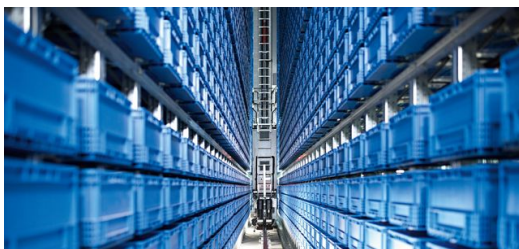
Das automatische Kleinteilelager (AKL) mit 23.000 Behälterstellplätzen.