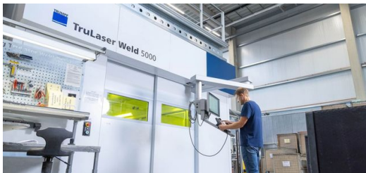
Mit der TruLaser Weld 5000 löst CoolCase drei knifflige Schweißaufgaben bei der Herstellung von Wechselrichter-Gehäusen.

Jetzt kommt der schweißtechnische Höhepunkt: An einer Öffnung am Gehäusedach setzt CoolCase einen Kühlkörper an. Er besteht allerdings aus einer schwer schweißbaren Aluminiumlegierung, die sich zudem vom Material des restlichen Bauteils unterscheidet. „Diese Legierung ist besonders anfällig für Heißrisse. Das ist ja genau das, was bei dem Gehäuse auf keinen Fall passieren darf.“ Darum wechselt die TruLaser Weld 5000 abermals die Schweißmethode und setzt jetzt per FusionLine einen Zusatzdraht ein. „Die richtigen Parameter zu finden war hier ein Drahtseilakt.“ Er grinst: „Details verrate ich aber nicht.“ Jedenfalls ist das Gehäuse jetzt dicht und die Elektronik im Inneren vor Wind und Wetter sicher.