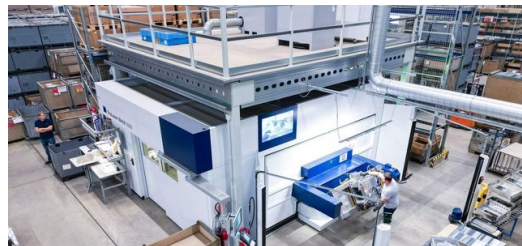
Mit der TruLaser Weld 5000 unterbietet CoolCase die Fertigungszeit für ein Wechselrichtergehäuse um 2,5 Minuten.