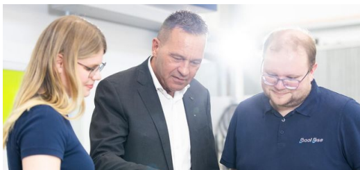
Gemeinsam mit TRUMPF arbeiten die beiden Jungunternehmer von CoolCase an den optimalen Schweißprozessen.

Doch bis CoolCase wirklich loslegen kann, Wechselrichter-Gehäuse in großem Stil zu schweißen, ist noch ein Stückchen Weg zu gehen. Das Gehäuse, das der Kunde möchte, sieht zwar unspektakulär aus, hat es aber schweißtechnisch in sich. CoolCase holt sich daher mit TRUMPF einen Partner an die Seite, um die optimalen Parameter und Schweißstrategien zu finden. Die Experten entscheiden sich für die Laserschweißanlage TruLaser Weld 5000 von TRUMPF und starten die Entwicklungsphase am konkreten Kundenprodukt.