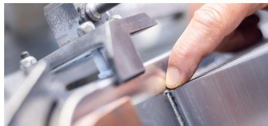
Die Schweißnähte der Gehäuse müssen absolut dicht sein, sodass die Elektronik des Wechselrichters bestens vor Umwelteinflüssen geschützt ist.