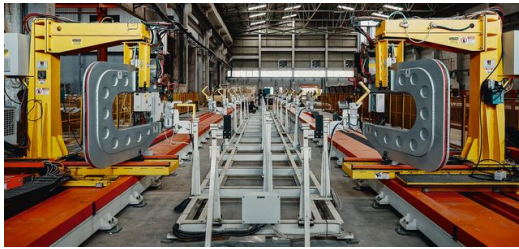
Viel Platz: Die Produktionshalle von Universal Engineers ist mehr als 20.000 Quadratmeter groß.