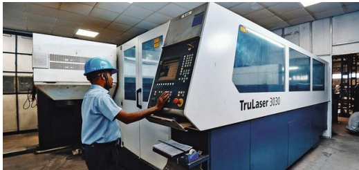
Universal Engineers setzt beim Laserschweißen von Zügen auf TRUMPF Technologie.