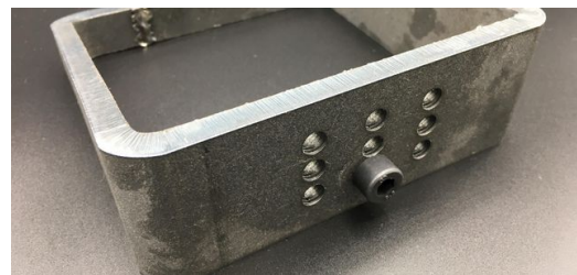
<p>Mit der TruLaser Tube 7000 lassen sich verschiedene Gewinde einbringen.</p>