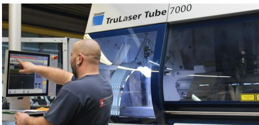
<p>Der Maschinenbediener bekommt das fertige Programm auf sein Terminal, um das Gewinde ins Rohr zu schneiden.</p> – Peter Klingauf