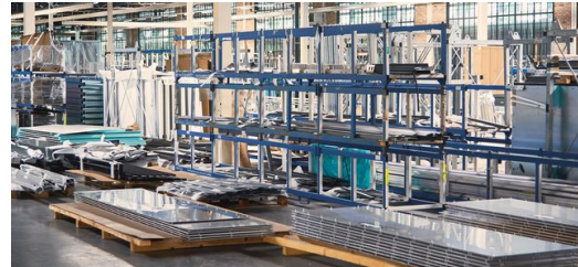
Alles aus einer Hand: Seit 2017 besitzt KFK eine eigene, ca. 360 Meter lange Glasfertigung.