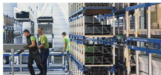
Neue Lösungen: Für ihre speziellen Aufträge muss KFK immer einen Schritt weiterdenken und flexibel agieren.