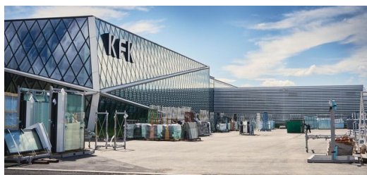
<p>Das KFK Gebäude in Kroatien.</p>