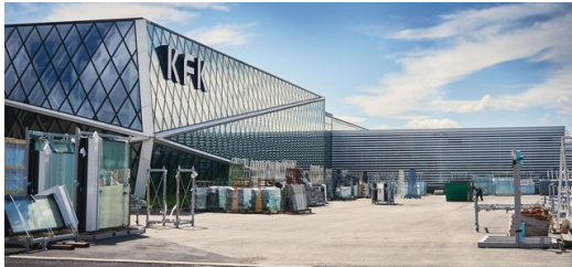
Das KFK Gebäude in Kroatien.

Früher fertigte KFK hauptsächlich für Kunden aus Kroatien. Heute ist das Unternehmen auf der ganzen Welt tätig. „Unser Fokus liegt im Moment auf dem Vereinigten Königreich, dort herrscht ein Bauboom. Immer höhere, immer raffiniertere, immer bessere Gebäude entstehen in allen Metropolen dieser Welt und London ist da keine Ausnahme“, so Papac. Er berichtet – nicht ohne Stolz – von KFKs derzeit größtem Projekt: „Wir arbeiten gerade an einem Wohngebäude in London. Es ist das höchste sich im Bau befindliche Wohngebäude Europas – mit 233 Metern Höhe und 76 Stockwerken. Das bedeutet natürlich auch, dass sehr viele Fassadenelemente gefertigt werden müssen.“ Bis ein solches Mammutprojekt fertiggestellt ist, dauert es mehrere Jahre. In diesem Fall sind es dreieinhalb.