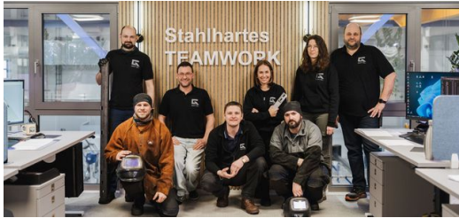
<p><strong>Wir-Gefühl: </strong>Erfolg und Qualität haben letztlich nur einen Urheber: das Team.</p>

Der Mut, mit neuer Technologie sein Geschäftsmodell zu erweitern, hat sich gelohnt. Götzl unterstützt inzwischen andere Laser-Rohrschneid-Dienstleister bei Großaufträgen, fertigt vielfältige Teile, auch Großserien, etwa für Fahrzeug-Wechselbrücken, Hochregallager, Sitzmöbel, Solarenergiesysteme. Als die erste TruLaser Tube 7000 im Dreischichtbetrieb ausgelastet ist, schafft er 2017 eine zweite an. Und wird bald nicht nur von den Maschinen, sondern auch vom Service von TRUMPF überzeugt.