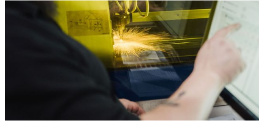
<p>In der Maschine glüht das Metall, am Monitor herrscht kühle Kompetenz.</p>