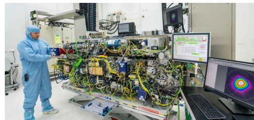
<p>Das Herzstück der Chipproduktion: Eine Komponente des weltweit stärksten gepulsten Industrielasers, der für die Licht-Erzeugung eingesetzt wird, um die EUV-Lithografie zu ermöglichen.</p>