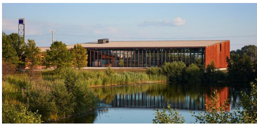
Der Standort Chicago ist für die Smart Factory von TRUMPF wie geschaffen. Rund 40 Prozent der blechbearbeitenden Industrie in den USA befinden sich in den direkt umliegenden Staaten.

„In Chicago erleben unsere Kunden einen vernetzten Maschinenpark, mit dessen Hilfe sich Aufträge automatisiert abarbeiten lassen. Kern der Smart Factory bildet eine verkettete Anlage, bei der mehrere Maschinen an ein STOPA Hochregallager angeschlossen sind. Digitale Lösungen steuern den gesamten Produktionsprozess und sorgen jederzeit für Transparenz, zum Beispiel über den Auftragsstatus oder den Materialbestand. Auf den Punkt gebracht: In Chicago zeigen wir unseren Kunden live, wie sie von digital vernetzten Fertigungslösungen profitieren können und wie die Blechbearbeitung der Zukunft aussieht.“