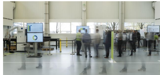
Im Vorführzentrum produzierten Mitarbeiter live ein Blechteil. Bildschirme zeigten ihnen wichtige Fertigungsinformationen an.