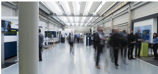
Großer Andrang auch bei den 2-D-Laserschneidanlagen.