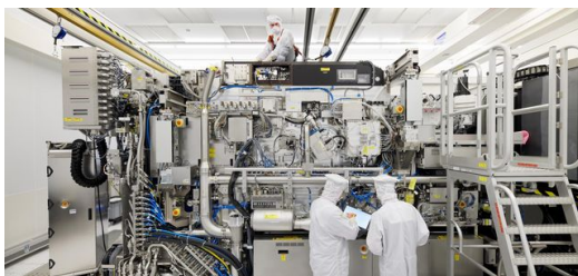
ASML-Mitarbeiter arbeiten an einer neuen Generation des EUV-Lithographiesystems NXE3400B.