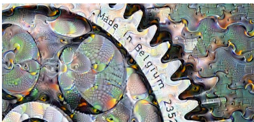
Der Traum im Werkstück?

Hinzu kommt, dass Laser, ausgestattet mit einem Rucksack voller Sensoren, Unmengen an Daten produzieren, die immer wertvoller werden. Mit menschlichem Erfahrungswissen trainierte Algorithmen werden in diesem Wust immer wieder neue Muster erkennen, die ein Mensch unmöglich sehen kann, und ihre Schlüsse daraus ziehen. Solche KI-Systeme werden genau in dieser Sekunde überall auf der Welt entwickelt. Sie werden nach und nach sowohl die Lasermaterialbearbeitung verbessern als auch die Laser selbst. Wie bei den Schachspielern von heute werden Laseranwender in zehn Jahren die besten Laseranwender aller Zeiten sein – und ihre KI lieben gelernt haben.