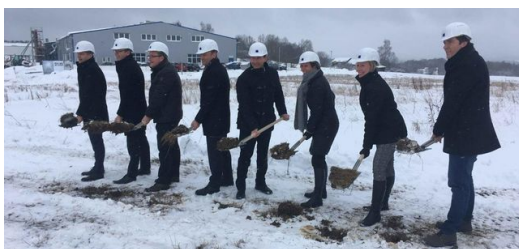
Spatenstich für die neue Produktionshalle am TRUMPF Standort Hettingen im Januar 2019. 120 Mitarbeiter sollen das Kompetenzzentrum in zwei Jahren beziehen.