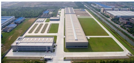
Bei der TRUMPF Tochter JFY wurde in Yangzhou im Mai 2018 der bislang größte Produktionsstandort der Gruppe weltweit eröffnet. Die Produktionsflächen betragen 19.000 m 2 .