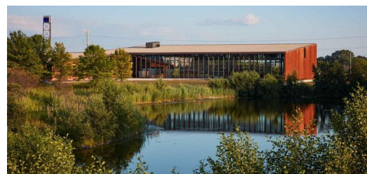
In Chicago hat TRUMPF im Jahr 2017 eine Smart Factory für die vernetzte Blechfertigung eingeweiht.