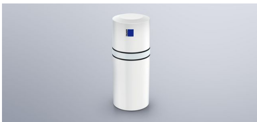
Satellit: Die in der Halle angebrachten Satelliten empfangen den Standort der Marker und übermitteln die Information an einen Industrierechner.