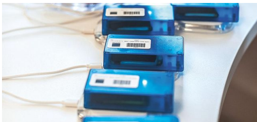
Prototyp: So sahen die Marker während der Testphase aus.