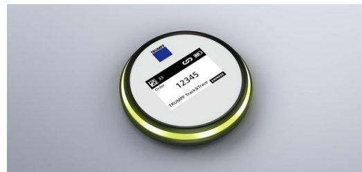
Marker: Nutzer können die Auftragsnummer und weitere Informationen digital auf das E-Ink-Display des Markers übertragen. Danach platzieren sie ihn einfach auf oder neben den Teilen des Auftrags.