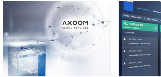
Ein ausgewählter Teil wird über das Internet an die AXOOM Cloud weitergeleitet.