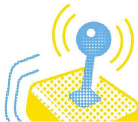
<p>Die Fernsteuerung fühlt sich einfach nur okay an. - Gernot Walter</p>