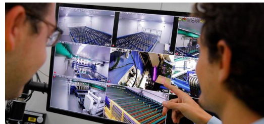
Ein hoher, aber nur sehr kurzer Wärmeeintrag ist für das Härten der Glasbeschichtung essenziell. Über fünf Jahre tüftelten die Glasspezialisten von Saint-Gobain am Rapid-Thermal-Processing Verfahren.

Diese Anlage auch industrietauglich zu machen, erwies sich allerdings technisch als undurchführbar. „Wir wandten uns an den Reutlinger Hightech-Maschinenbauer Manz“, erzählt Lorenzo Canova. Die Experten dort brachten TRUMPF ins Spiel und eine vierjährige Entwicklungspartnerschaft nahm ihren Anfang.