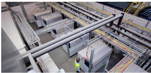
Zwölf Hochleistungslaser erzeugen 144 Kilowatt Leistung.