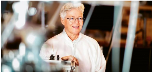
Prof. Anne L'Huillier hat einst das Tor zur Physik der Attosekunden-Laserpulse aufgestoßen. Mit ihrer Forschung rückt sie jetzt den Elektronen auf die Pelle.

L'Huillier: Es ist schwer, eine wohldefinierte Vision zu geben. Es ist eben Grundlagenforschung.