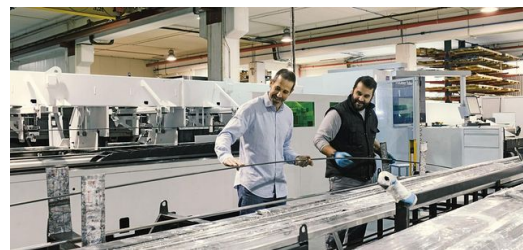
Hydracorte ist Teil der Caamaño Group, einem globalen Netzwerk von Unternehmen, das auf den Bau, die Sanierung und Einrichtung von Shops spezialisiert ist. Hydracorte steht als Metallteile-Lieferant am Anfang der Produktionskette und fertigt von kleinen, filigranen Teilen bis hin zu großen Baugruppen. Dazu gehören Schilder, Möbel, Verkleidungen, Fassaden und mehr.