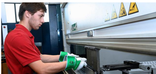
<p>Assistenzsysteme und Software helfen bei der Arbeit: Die TruBend

Bis Fischer auf TecZone Bend kam. Das TRUMPF Programm simuliert Biegungen in 3D und prüft automatisch die Machbarkeit. „Faszinierend!“, fand Fischer, „wir haben gleich gesagt, ok, das brauchen wir!“ Schnell wurde jedoch auch klar: „Um das Programm voll auszunutzen, brauchen wir dazu eine TRUMPF Abkantbank.“ Dann investierte Fischer in die TruBend 5230 – und hat es nicht bereut. Ausschlaggebend waren dabei nicht zuletzt die drei Optionen Part Indicator, ACB Laser und ACB Wireless.