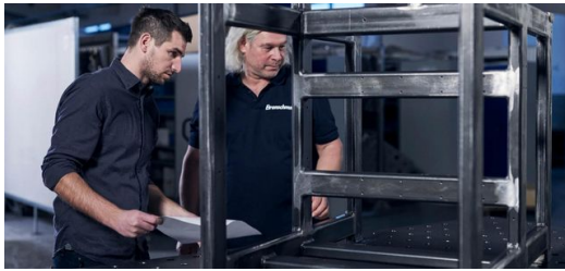
<p>Die Zeitersparnis, die Programming Tube bei der Programmierung bietet, wirkt sich vor allem bei komplizierten Schweißbaugruppen positiv auf die komplette Durchlaufzeit aus.</p>