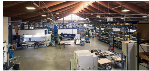
<p>Mit derzeit 200 Mitarbeitern in Schwabsoien und 150 weiteren bei der Tochtergesellschaft blechTech in Augsburg ist die Eirenschmalz Unternehmensgruppe Komplettanbieter in der Blechfertigung. Neben einfachen Laserteilen fertigt das Unternehmen anspruchsvolle Präzisionslaserteile sowie Baugruppen und komplexe Systemkomponenten.</p>