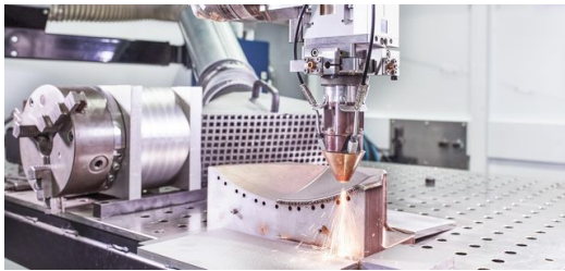
Auftrag wird ausgeführt: Ein TRUMPF Laser trägt auf ein Werkzeug für eine Presse in der Automobilindustrie eine Metallschicht auf.