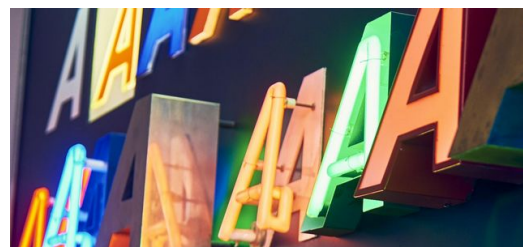
Erfolgsrezept des Marktführers für Schilder und Aufsteller: Technologie gepaart mit Kreativität