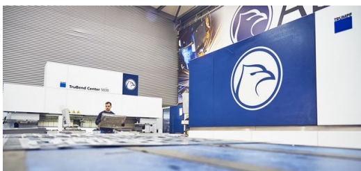
Modernste Technologie: Arbeiter mit der TruBend Center 5030