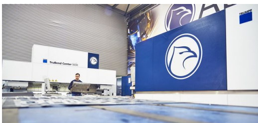
Modernste Technologie: Arbeiter mit der TruBend Center 5030