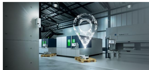
So können Blechfertiger Aufträge, Ladungsträger und Transportmittel nachverfolgen und dadurch Prozesse optimieren.