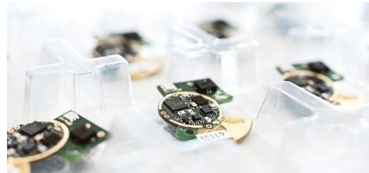
Klein, kleiner, BeSpoon-Chip: Ohne ihn funktioniert nichts.