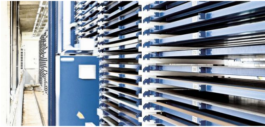
Das moderne Hochregallager ist auf dem neuesten Stand der Technik und war der erste Schritt zur digitalen Vernetzung. Stück für Stück folgt nun auch die passende Softwareeinbindung.