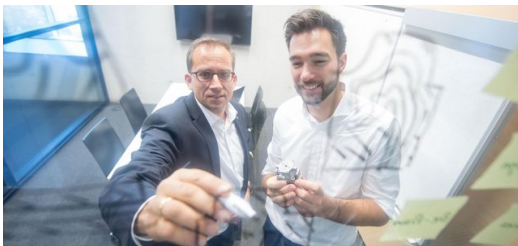
<p>Denken „in 3D“ will gelernt sein. Konstrukteure müssen sich von klassischen Regeln wie „man kann nicht um die Ecke bohren“ lösen und freier im Kopf werden. Neue Software, die automatisch Design-Vorschläge liefert, unterstützt sie dabei.</p>