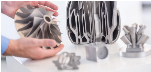
<p>Luft- und Raumfahrt, Automotive oder Medizintechnik: Die Anwendungen für 3D-Druck sind genauso vielfältig wie die Technologien und Materialien. Doch was sind die wichtigsten Trends?</p>

Ein weiterer Multitrend ist die Kombination von 3D-Druck mit anderen Bearbeitungsverfahren innerhalb einer einzigen Maschine, zum Beispiel mit Fräsen und Bohren. Im Moment – und auch auf lange Sicht – ist das Bearbeitungstempo von 3D-Druck und von konventionellen Verfahren noch zu unterschiedlich, als dass es sinnvoll wäre, sie in eine einzige Maschine zu packen. Leider macht man damit das eigentlich großartige 3D-Drucken zum lästigen Bremsklotz für die anderen Verfahren. Bei anderen additiven Verfahren, wie etwa dem Laserauftragschweißen (LMD), sieht die Sache heute allerdings schon anders aus.