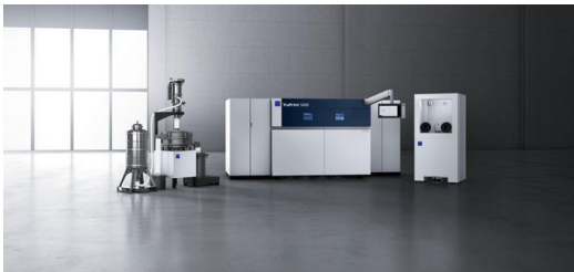
<p>Wie viel Automatisierung braucht der 3D-Druck? Zurzeit fragen eher große Konzerne komplette Automatisierungslösungen an. Klassische Job-Shops betreiben die Anlagen lieber alleine.</p>