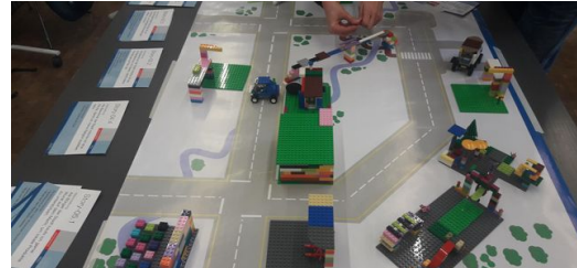
Beim Workshop „Scrum Lego City“ bauen wir mit der Scrum Methode eine Stadt aus Lego Steinen.