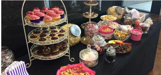
Bei Cupcakes und Brownies lernen sich die Teilnehmer der 1. AgileDays bei TRUMPF besser kennen.

indem sie als Team eine Stadt aus Lego-Steinen planen und bauen. Das Konzept stammt aus der Softwareentwicklung und wird heute in den verschiedensten Branchen eingesetzt. Für unsere Lego-Stadt erhalten wir konkrete Vorgaben, zum Beispiel ein Schwimmbad mit Rutsche oder Infrastruktur für öffentliche Verkehrsmittel. Im „Backlog“ und im „Planning“ beurteilen wir die Bauprojekte nach ihrer Komplexität und legen die Zeitschiene und die Verantwortlichkeiten fest. Im Sprint stürzen wir uns auf die bunten Legohaufen und bauen Schaukeln, Fahrradständer und Krankenhäuser. Bevor wir alles im nächsten Sprint wiederholen, werfen wir im „Review“ einen Blick auf die Ergebnisse und legen in der „Retro“ Optimierungsmaßnahmen fest. So kommen wir in weniger als einer Stunde zu einer perfekten Stadt.