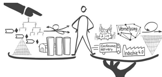
Für eine flexible Organisation ist beides nötig: Stabilität und Agilität. Grafik: Denis Gabriel

Vieles ist heute schneller und einfacher als in den vergangenen Jahrzehnten. Dazu zählt auch: Kapital. Geld ist nicht mehr das limitierende Mittel, es sind die Menschen, die klugen Köpfe, die benötigt werden. Im Industriezeitalter wurde viel Zeit in die genaue Planung gesteckt, denn es war schwierig an Kapital zu kommen. Heute wird viel eher ausprobiert. Der