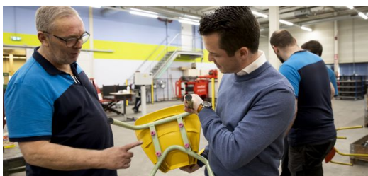
<p>Gemacht für ein langes Schulleben: Stühle wie der Gispén WIZZ chair sind stabil und robust. Außerdem machen sie den Schulalltag etwas bunter.</p>