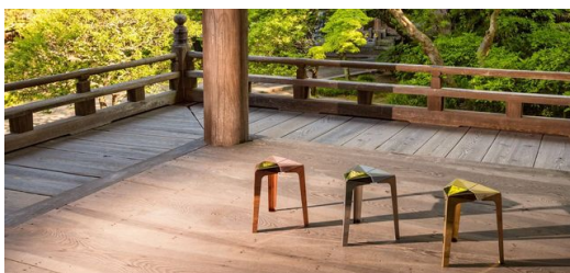
Der Stuhl „Orisu“ ist etwas Besonderes: Er macht abstrakte Technologien für den Betrachter sichtbar.