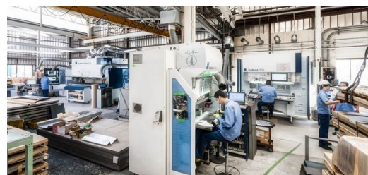
Verschiedene TRUMPF Maschinen in der Produktionshalle von KANEYOSHI sorgen für eine effiziente Fertigung.