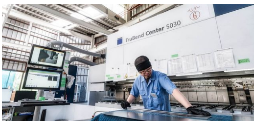
Ein Mitarbeiter arbeitet an der TruBend Center 5030 . So wird der Stuhl „Orisu“ hergestellt.