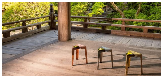
Der Stuhl „Orisu“ ist etwas Besonderes: Er macht abstrakte Technologien für den Betrachter sichtbar.