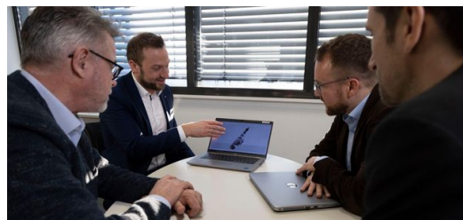
Die von TRUMPF speziell für BENTELER entwickelte MultiFokus-Optik bringt in Verbindung mit BrightLine Weld hervorragende Ergebnisse beim porenfreien gasdichten Schweißen von Aluminium.