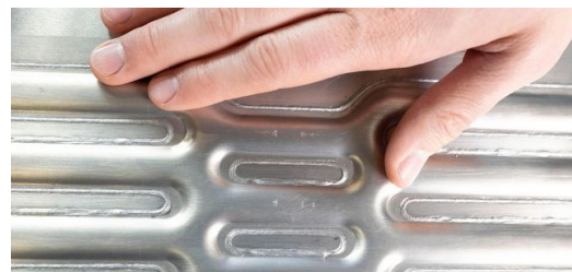
Beim von BENTELER entwickelten Faltkastenkonzept für ein Batteriegehäuse aus Edelstahl sorgt die patentierte TRUMPF Lösung BrightLine Weld auch im schnellen Serienbetrieb für eine spritzerfreie Bearbeitung und hochfeste gas- und heliumdichte Schweißnähte.