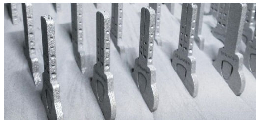
Das 3D-Druck-Verfahren erlaubte es den jungen Ingenieuren von UrbanAlps, die Form von Schlüsseln völlig neu zu denken.