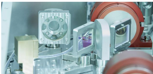
Optikaufbau für Laserverstärker in der Wissenschaft.

Unterm Strich gilt für alle, die heute ein Business gründen wollen: Wer auf der Suche nach einer Idee ist, die sich nicht in Software-Zeilen erschöpft, sollte sich anschauen, was man mit Lasern machen kann. Oder sich genau überlegen, was Leute brauchen, die mit Lasern arbeiten. Oder nachdenken, was man mit Lasern tun kann für Leute, die etwas Neues vorhaben – oder einfach nur die Welt retten wollen.