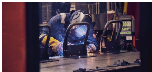
Bei Hutchinson Engineering fertigen 100 Mitarbeiter für Kunden aus verschiedenen Branchen - von Busherstellern bis hin zur Luftfahrt-Industrie.