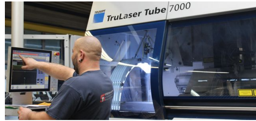
<p>Der Maschinenbediener bekommt das fertige Programm auf sein Terminal, um das Gewinde ins Rohr zu schneiden.</p> – Peter Klingauf