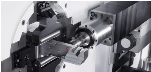
<p>Mit der Gewindeeinheit lassen sich normale Gewinde ebenso einbringen wie Fließgewinde.</p>