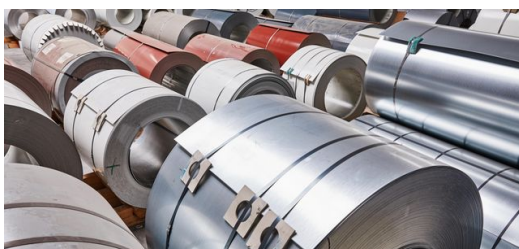
Um alle Kunden innerhalb von 48 Stunden beliefern zu können, hält Wagner ein großes Materiallager vor. Neben Stahlblech von 0,75 bis fünf Millimeter Dicke verarbeitet die Firma auch verzinktes Stahlblech, Alu, Titanzink, Kupfer und Edelstahl.