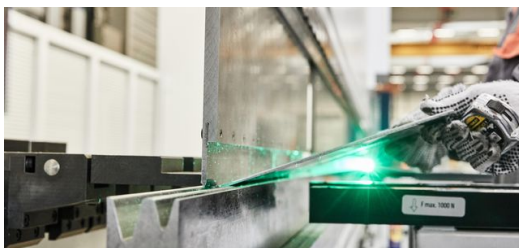
Das Hinteranschlagsystem der neuen TRUMPF EHT VarioPress 500 ist mit Biegehilfen und einer Hochhalteeinrichtung gekoppelt, die CNC-gesteuert zum Einsatz kommen.

Zu Wagners Kundenstamm gehören neben Großkunden, für die er Aufträge zwischen 15 und 20 Tonnen fertigt, auch viele Kleinkunden – Handwerker oder auch Privatleute, die Einzelstücke bei ihm ordern. Um alle innerhalb von 48 Stunden beliefern zu können, hält Wagner ein großes Materiallager vor: allein im Bereich farbeschichtetes Stahlblech stehen aktuell 52 RAL-Farben zur Wahl. Neben Stahlblech von 0,75 bis fünf Millimeter Dicke verarbeitet Wagner auch verzinktes Stahlblech, Alu, Titanzink, Kupfer und Edelstahl.