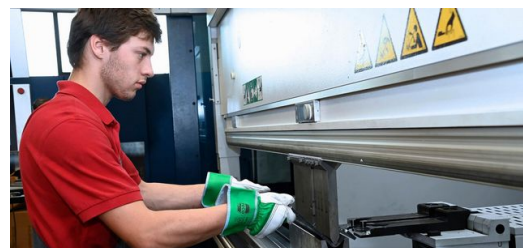
<p>Assistenzsysteme und Software helfen bei der Arbeit: Die TruBend