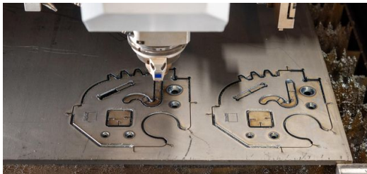
<p>Das Bauteil wurde noch auf der Standardmaschine fürs Laserschweißen angefast. Damit spart TRUMPF aufwendige Folgeprozesse ein.</p>