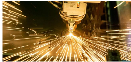
<p>Der Laser einer TRUMPF Schneidmaschine erzeugt schräge Schnittkanten an den Konturen des Bauteils, sogenannte Fasen. </p>