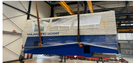
Schwere Fracht: Die sieben Tonnen schwere Bar bei der Ankunft in der Montagehalle der Firma Matyssek Metalltechnik.